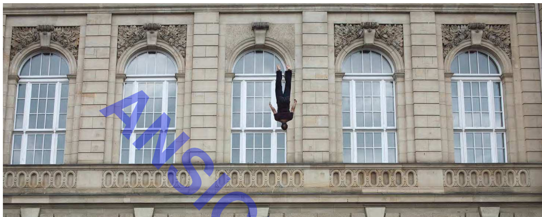
Fabian Knecht/Endung, 2014