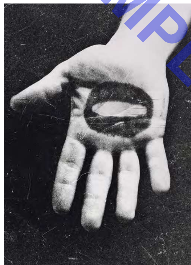
„Eintrittskarte“ für den ZERO-Mitternachtsball der Herz von Heinz Mack, 1966

Geburt und Tod markieren die Grenzen unserer Existenz. Das Wunder Leben liegt dazwischen. Yves Klein und Otto Piene haben ihre Briefe häufig mit dem optimistischen Ausruf „Vive Zéro“ beendet. In diesem Sinn nutzen wir heute unsere einmalige Chance und proklamieren energisch: