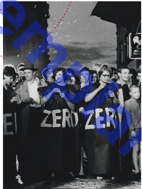
Zur Präsentation der dritten und letzten Ausgabe der Zeitschrift ZERO in der Düsseldorfer Galerie Alfred Schmela am 5. Juli 1961 ließen junge Frauen und Männer in schwarzen Kleidern aus Papier Seifenblasen steigen