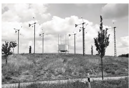
Pablo Wendel: Off Road , A40 bei Dortmund, Juni–September 2014, sowie Skulpturenpark Katzow bei Greifswald, seit Dezember 2014

Die Straßenwindinstallation Off Road besteht aus einem Ensemble von sieben je acht Meter hohen Windskulpturen und einer Power Station . An der Forschung und Entwicklung zu Off Road beteiligte sich ein transdisziplinäres Team; wissenschaftliche Unterstützung leistete das IAG – Institut für Aerodynamik und Gasdynamik der Universität Stuttgart.